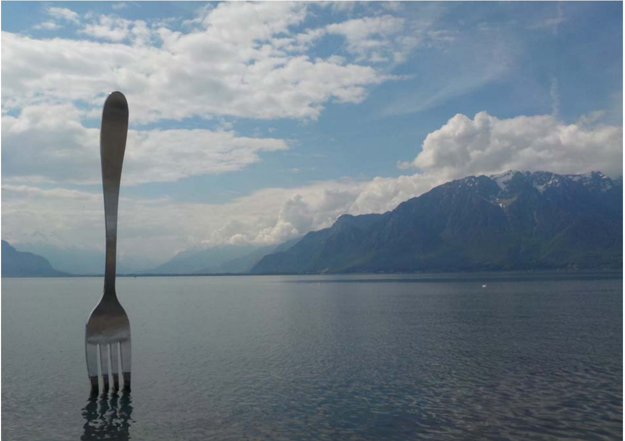
Découvrez l'Alimentarium de Vevey.