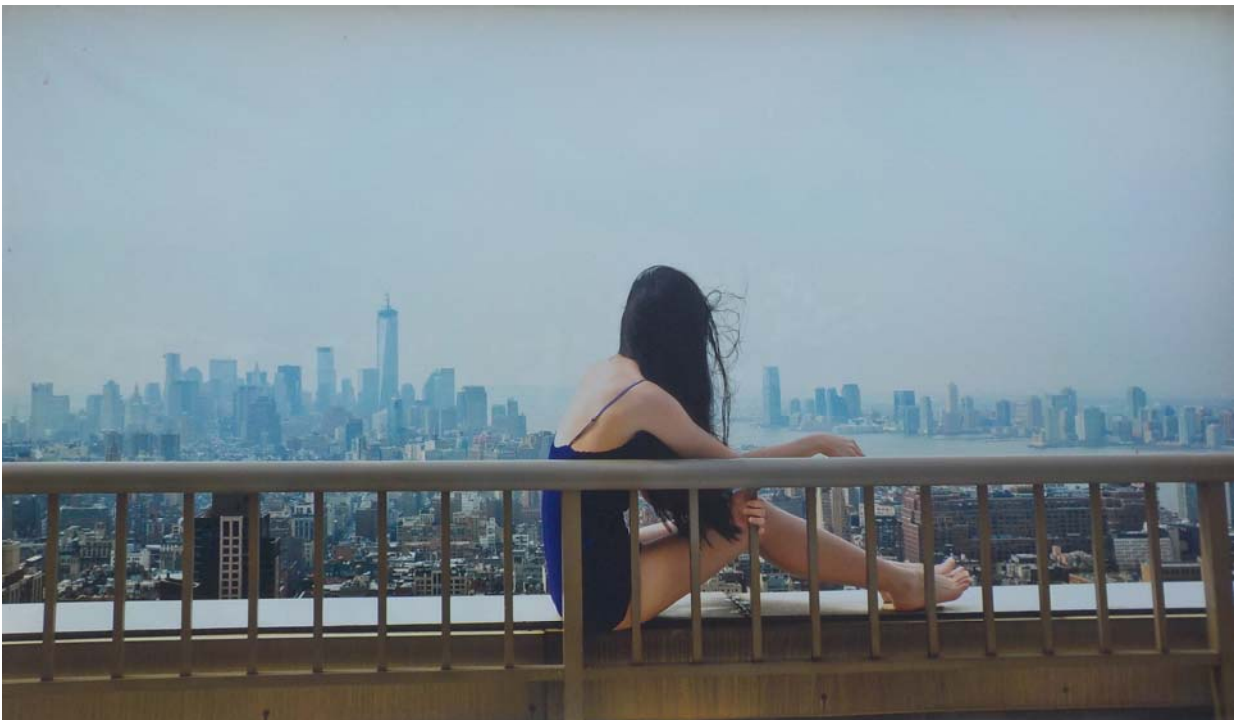
L'invitation au voyage.